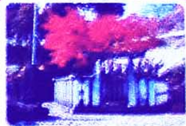
(菓子ヶ池) 花道公園では春は桜、秋はもみじが楽しめます。